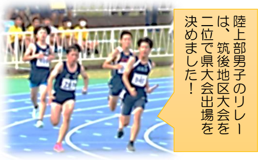
陸上部男子のリリーは、筑後地区大会を二位で県大会出場を決めました！

また、7月1日、4日の両日で、ほとんどの競技の八女地区大会が開催されます。3年生にとってはこれが最後の中体連の大会です。これまで培ってきた全てのことを全力で発揮でき、そんな大会であってほしいと思います。頑張れ、広中生！